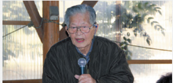
▶小岱大先輩も元気に参加 ▶次年度5役紹介