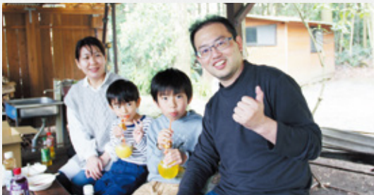
▲楽しそうなL杉浦ファミリー