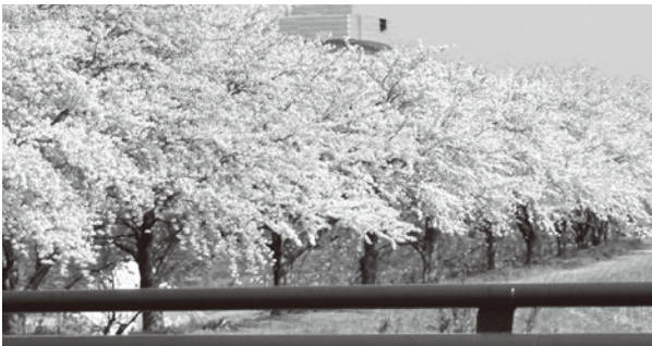
▲能登に癒しの桜が