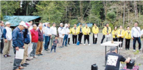
◀近江八幡L・Cの皆さんとの家族例会 ▶料理に舌つつみ

又、前夜には「じねん坊」にて歓迎の集いもあり、双方打ち解けた交流で、大変有意義な時間だったと思います。それぞれのクラブメンバーによる自己紹介もあり、楽しい一日でした。今後も夫婦提携クラブとして一層親睦を深めて参りたいと思います。