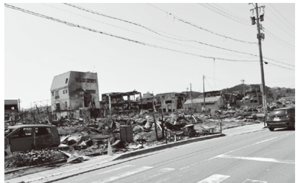
▲焼け落ちた輪島朝市