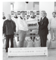
▲社会福祉協議会へ園児と収穫したジャガイモを寄贈

子どもたちは育てる喜びを学び、地域福祉に貢献する機会を得ることができた事業となりました。