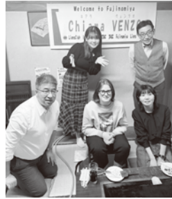
▲歓迎会で富士宮やきそばを堪能したキアラさん