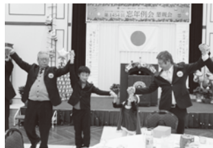
▲子供たちと「また会う日まで」