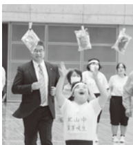
▲子供達が一番楽しみなパン取り競争