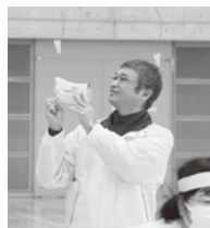
▲パン食い競争、最近はずり取りです