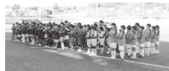
▲表彰式に参加した小学生の皆さん

子どもたちの熱意とプレーに元気をもらい、今後も地域を支えるイベントとして継続していきたいと感じる一日となりました。