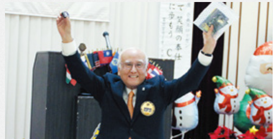
▲L 西川ラペルピン贈呈