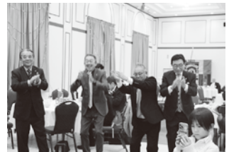
▲陽気なおじさんたち