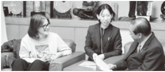
▲市長と歓談するキアラさん（左）