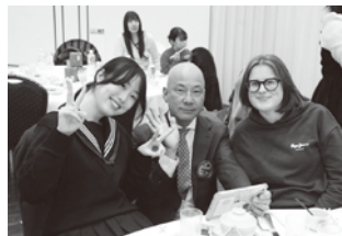
▲嬉しそうなお望月