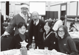
▲サンタ会長と一緒に!