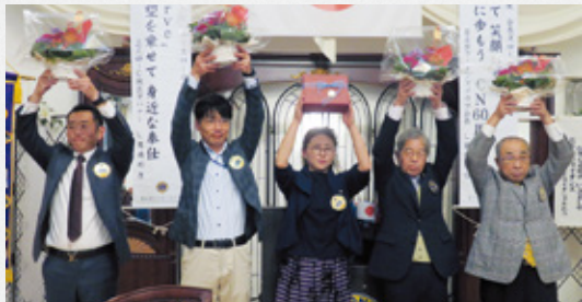
▲誕生日おめでとうございます