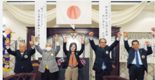
▲三献委員会のローア