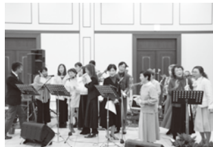
▲奥様方による恋のバカンス♪