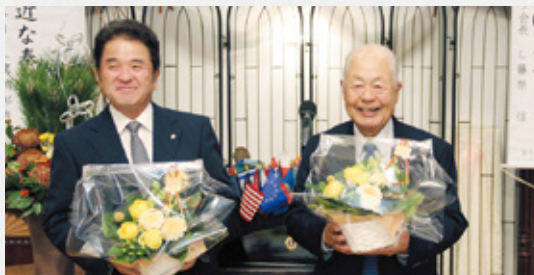
▲誕生日に満面の笑み