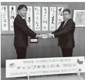
▲L藤原よりチャンプ本贈呈

今後も青少年育成事業にも力を注ぎ、地域の未来を支える活動を続けていきたいと思ひます。