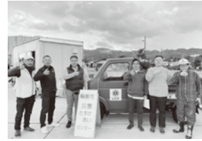
▲中央ライオンズクラブと!