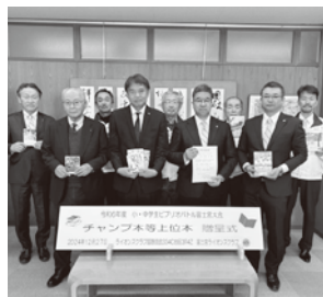
▲市内の小中学校図書室へ