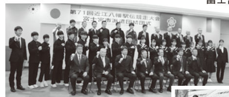
▲市役所にて団結式